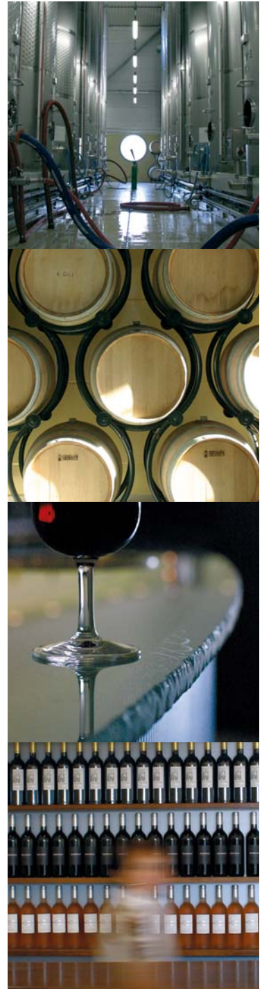
GUYERANCO FORTILLO DESIGN / PHOTOS SYRIE FASSADÉ / IMPRESSION LAFFONT